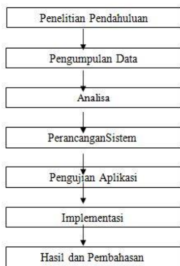
Gambar 1. Kerangka Penelitian

Metodologi penelitian adalah suatu ilmu pengetahuan yang membicarakan mengenai bagaimana cara-cara dalam melaksanakan suatu penelitian yang benar, yang membahas tentang bagaimana mencari, mencatat, merumuskan, serta menganalisis sampai menyusun laporan berdasarkan fakta-fakta atau gejala-gejalasecara ilmiah Gambar.1.