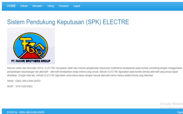
Gambar 3. Halaman Home

Dalam halaman home , user dapat melihat profil perusahaan dan defenisi dari sistem penunjang keputusan. Berikut tampilan pada halaman Profil pada Gambar 3.